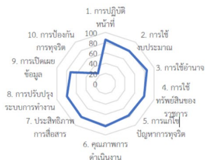
ที่มา : รายงานสรุปผลการประเมินคุณธรรมและความโปร่งใสของวิทยาลัยการศึกษาระดับอุดมศึกษาและจัดการทางทะเล 2565